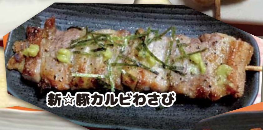
新☆豚カルビわさび