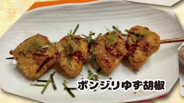
ボンジリゆず胡椒