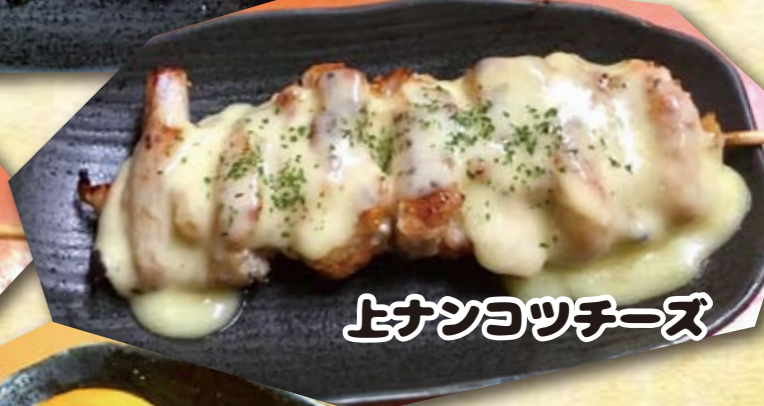
上ナンヨツチーズ